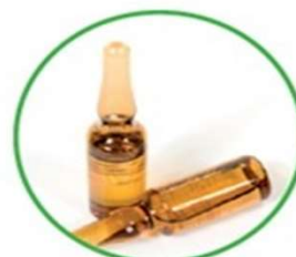
Confezioni in vetro dei farmaci usati