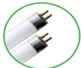
Tubi al neon