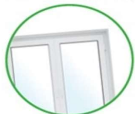
Vetri di finestre, finestrini di auto, vetri di fari e fanali