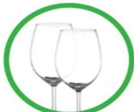
Oggetti in cristallo (bicchieri, lampadari, centrotavola, etc.)

C'è vetro e vetro. Perché alcuni oggetti, che istintivamente butteremmo nell'apposito contenitore per la raccolta del vetro, hanno in realtà un'altra destinazione. Eccoli: