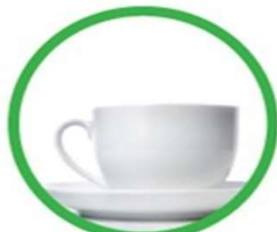
Oggetti in ceramica e porcellana