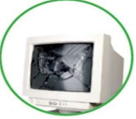
Tubi del televisore e schermi di tv, computer, monitor