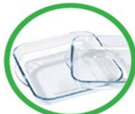
Contenitori in vetroceramica (pyrex, etc.)